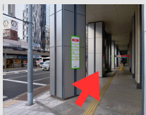
③南海堺東ビルに沿って北へ向かう