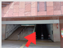
④正面玄関の階段・エスカレーターで3階へ向かう