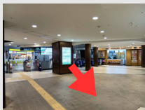
①下り階段へ向かう