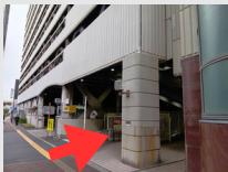
①南海堺東ビル駐車場・駐輪場の一番右側の通路へ