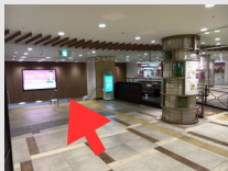
②階段を下りて1階へ