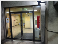
②扉を開けてエレベーターで8階へ